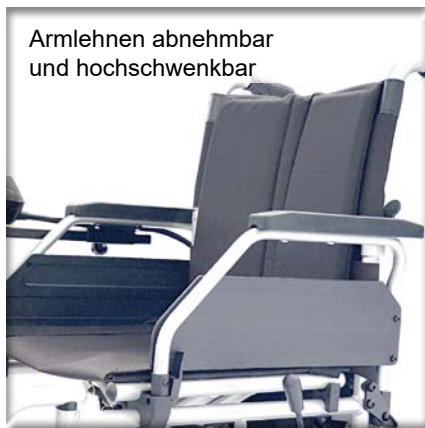
Armlehnen abnehmbar und hochschwenkbar