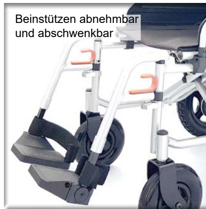
Beinstützen abnehmbar und abschwenkbar